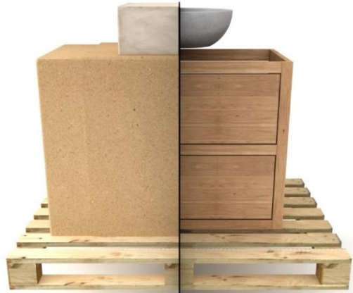
1. Levering uitpakken