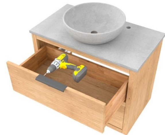
4. Grepen monteren