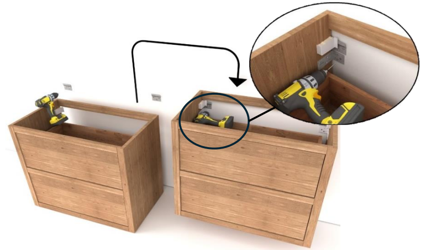
2. Montageplaten aan muur bevestigen en meubel ophangen*

* Extra montagehoeken meegeleverd voor sterkte, ophangstelsel verstelbaar