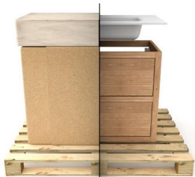
1. Levering uitpakken