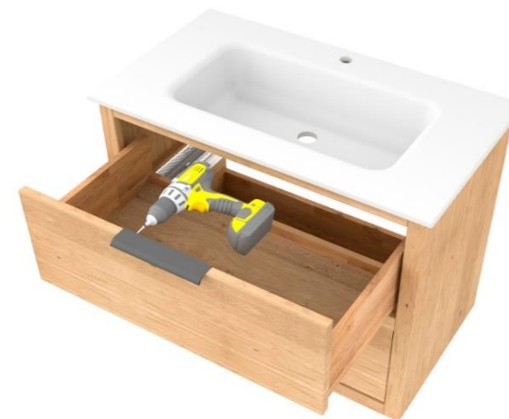
5. Grepen monteren