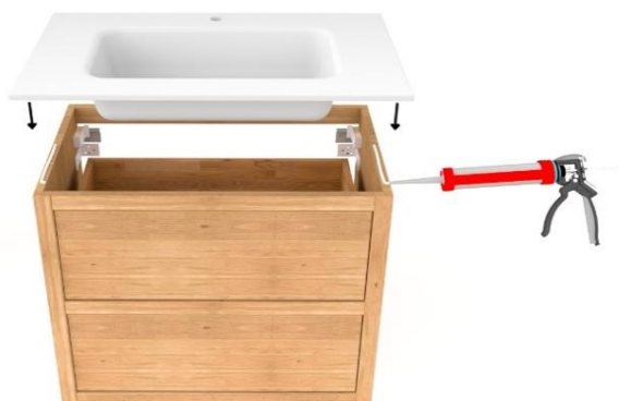
4. Wastafel met kit bevestigen op het meubel