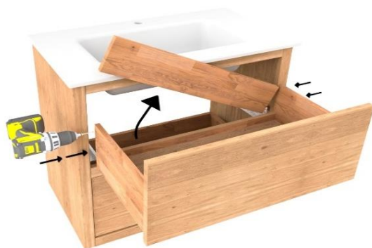
3. Lade achterkant verwijderen voor extra ruimte wastafel

* Extra montagehoeken meegeleverd voor sterkte, ophangstelsel verstelbaar